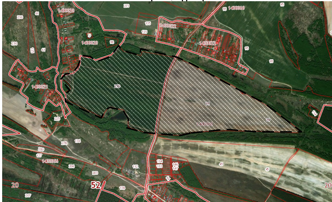
Схема границ территории

к постановлению администрации городского округа город Бор Нижегородской области От 12.09.2019 № 4961