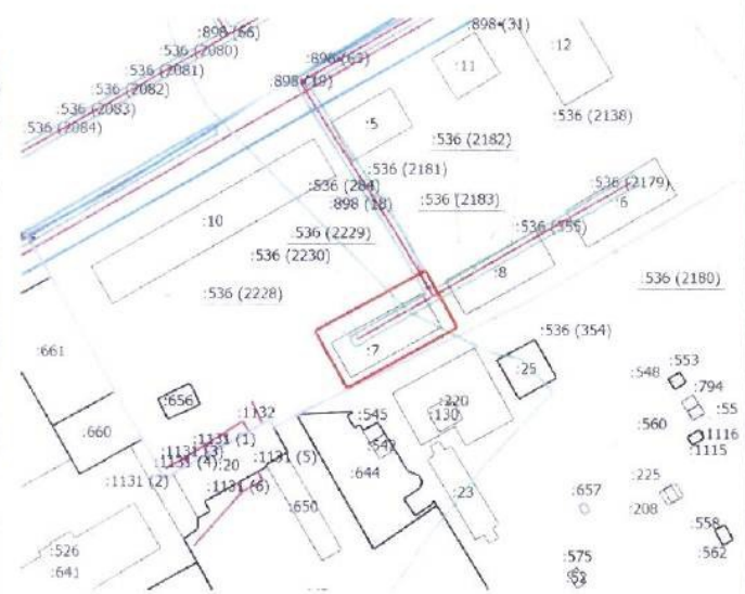
Способ образования земельного участка путем перераспределения земельного участка с кадастровым номером 52:19:0102019:7