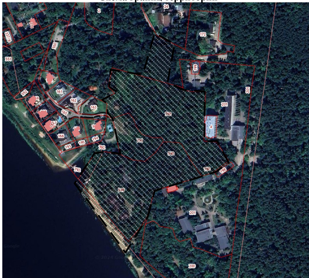
Схема границ территории

к постановлению администрации городского округа город Бор Нижегородской области От 06.06.2024 № 3395