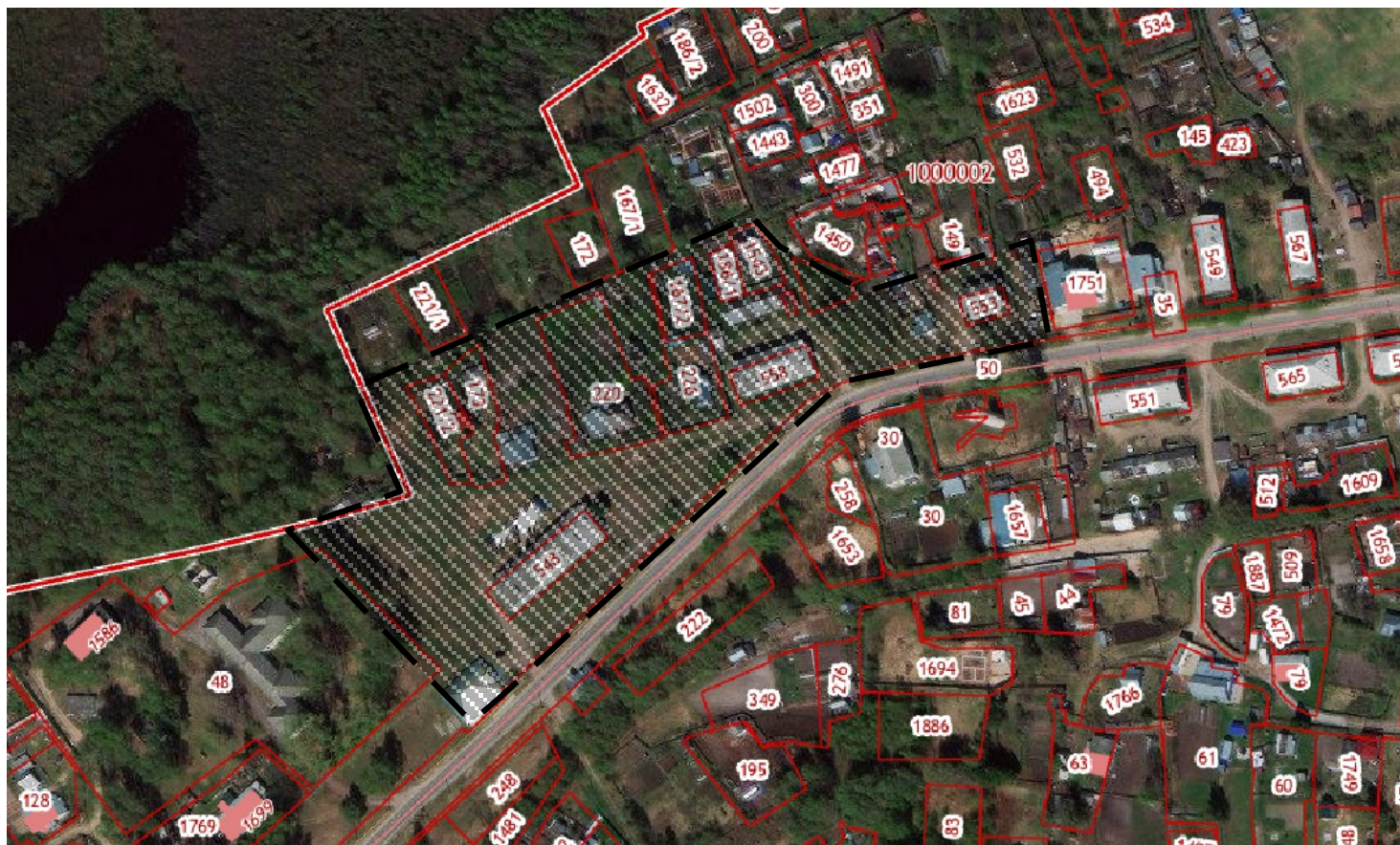
Схема границ территории для подготовки проекта планировки и межевания территории