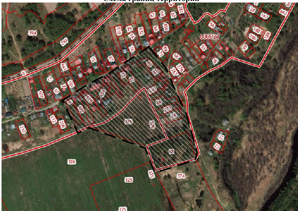
Схема границ территории

к постановлению администрации городского округа город Бор от 30.09.2020 № 4376