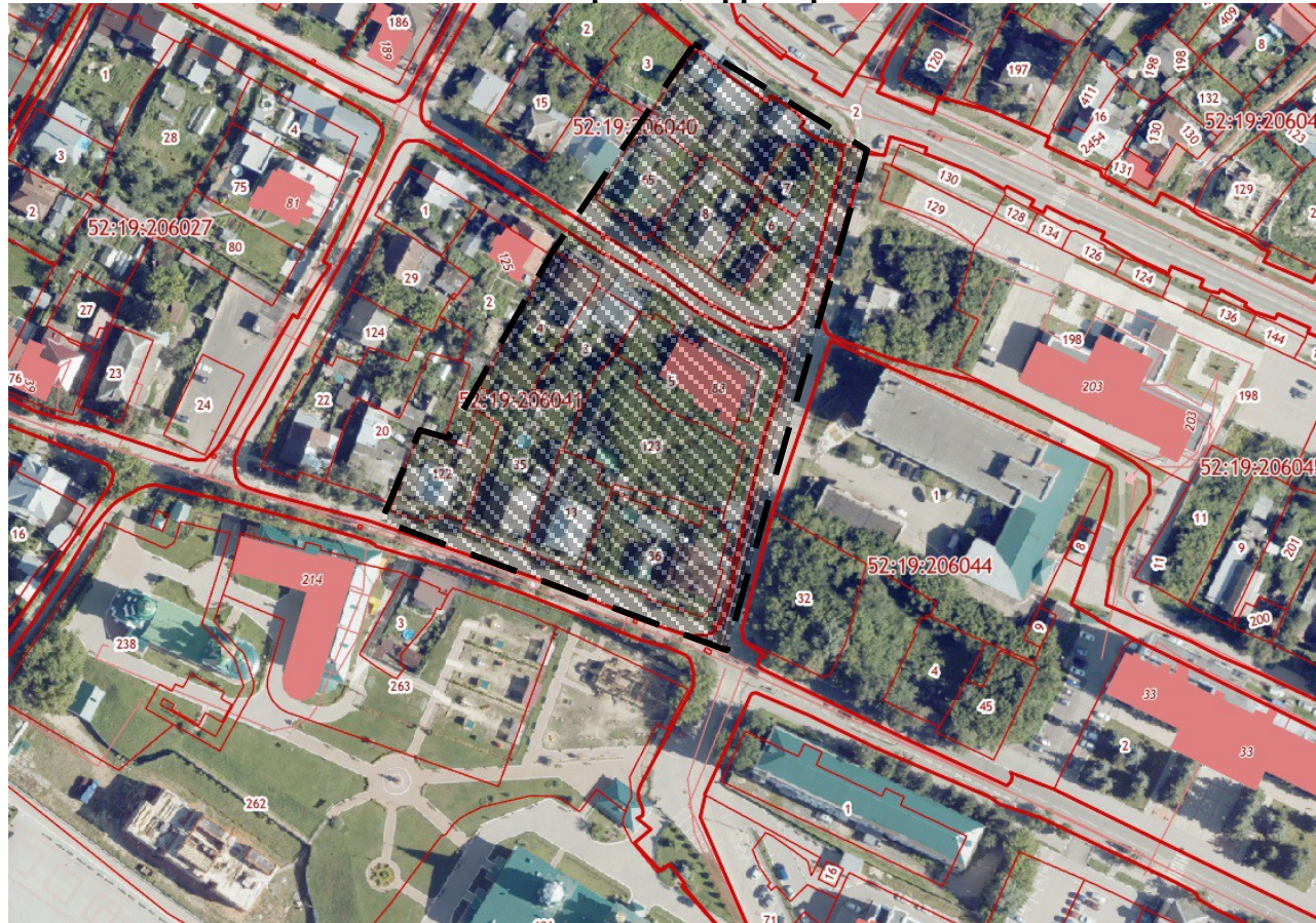
Схема границ территории