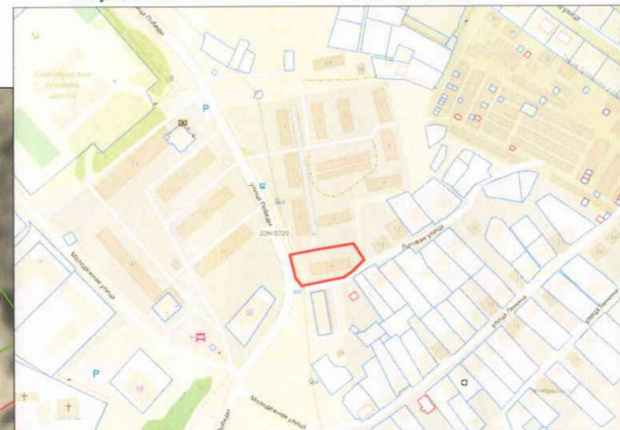
Ситуационный план Масштаб 1:5000

УТВЕРЖДЕНА Постановлением администрации городского округа город Бор Нижегородской области от _____ № _____